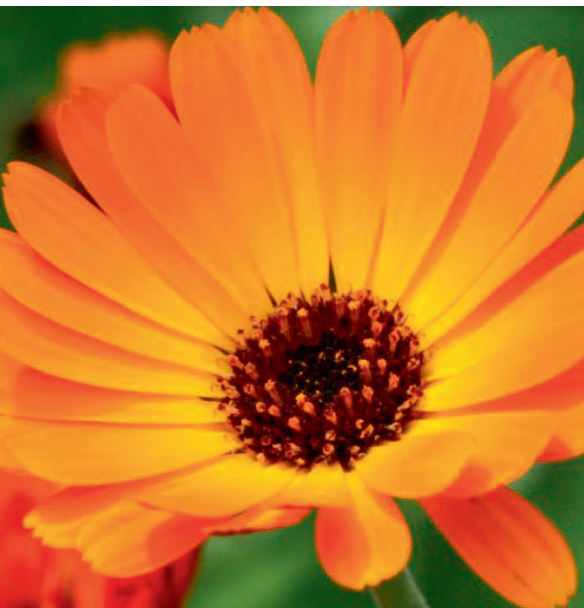
Calendula – Ringelblume

der Herstellung und der nichtindividuellen Anwendung. Zur Phytotherapie gehören u. a. pflanzliche Extrakte für Tees und Umschläge, Präparate zum Einnehmen oder äußerlich anzuwendende Salben zum Beispiel mit Arnika, Kamille, Ringelblume oder Propolis. Gerade für Neurodermitiker aber gilt: Vorsicht – einige Pflanzen bzw. Pflanzenprodukte, insbesondere Arnika und Propolis, lösen häufig Allergien aus!